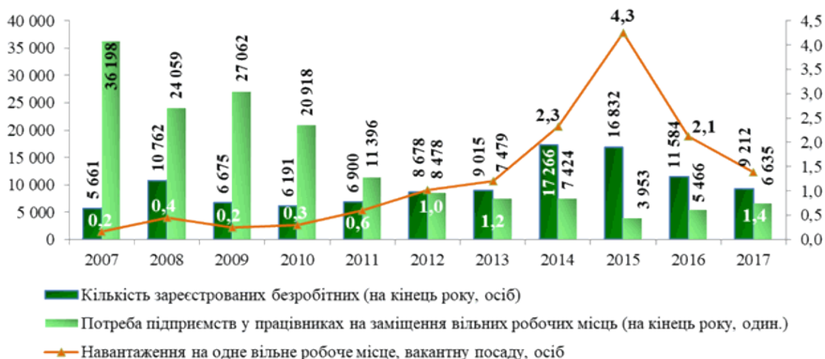
Рисунок 1.2 - Динаміка збалансованості ринку праці м. Києва

Станом на 1 січня 2018 року у базі даних столичної служби зайнятості налічувалося 6635 вакансій, що на 21,4 % більше, ніж на 1 січня 2017 року. Найбільший попит роботодавців спостерігався на кваліфікованих робітників з інструментом, а також фахівців та професіоналів (відповідно 17,4 %, 14,8 % та 14,5 % загальної кількості вільних вакансій на кінець року), найменший - на представників найпростіших професій та осіб без професії. За професійними групами частка додаткової потреби на кваліфіковані кадри, підготовка яких здійснюється у професійних (професійно-технічних) закладах освіти, в загальному обсязі додаткової потреби на ринку праці столиці на кінець 2017 року становила 48,9 %. За видами економічної діяльності у 2017 році майже кожна п'ята вакансія пропонувалась в оптовій та роздрібній торгівлі (19 %), у державному управлінні й обороні (12,2 %), на транспорті (11,2 %), на підприємствах та установах переробної промисловості (11 %). При цьому найбільша кількість претендентів на одне вільне робоче місце спостерігалася у сфері фінансової та страхової діяльності (15 осіб), постачання електроенергії, газу та пари та сфері інформації та телекомунікації (6 осіб), а найменша - у сферах водопостачання, транспорту, охорони здоров'я.