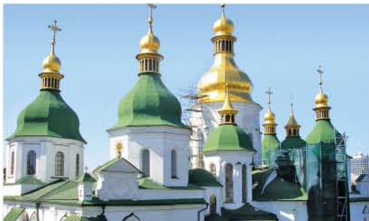
1 Собор святої Софії/St. Sophia Cathedral Софійська площа/Sophia Square www.nzck.org.ua

Зведений в XI ст. князем Володимиром Великим, це один із найдавніших храмів Київської Русі, що зберігся до наших днів. Собор став частиною архітектурного образу Верхнього Києва. / The Cathedral was built at the beginning of the XI century by Prince Volodymyr the Great. It is one of the oldest cathedrals of Kyivan Rus that has survived to present day. The Cathedral has become an integral part of the architectural landscape of upper Kyiv.