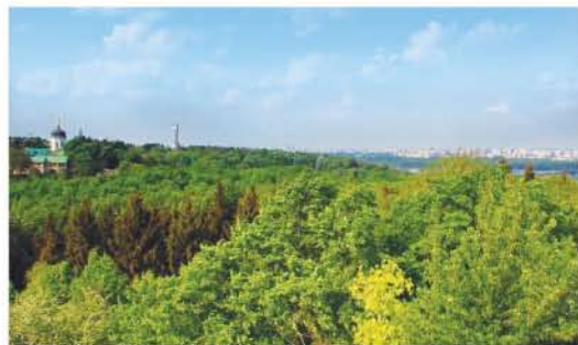
6 Національний ботанічний сад/The National Botanical Garden Вул. Тимирязєвська, 1/Tymiryazevska St, 1 www.nbg.kiev.ua

Палац зведено в 1750–1755 рр. архітектором Б. Растреллі. Головний фасад палацу виходить на парк, закладений 1874 р. на зразок саду Петра І. Архітектура палацу виконана у стилі бароко. / It was constructed in 1750–1755 by architect V. Rastrelli. The architecture and interior design follow the baroque style of the XIX century. The park, founded in 1874, modeled off of the gardens of Peter I.