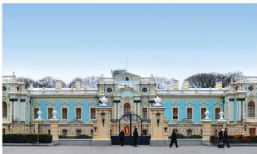
5 Маріїнський палац та парк/Mariyinsky Palace and Park Вул. М. Грушевського, 5/M. Hrushevsky St, 5

Унікальна пам'ятка оборонної архітектури Київської Русі XI ст., що була частиною потужної ланки укріплень і одним із в'їздів до Києва. До XVIII ст. ворота входили до системи Старокиївської фортеці. / The Golden Gate is a historic defensive fortress of Kyivan Rus of the XI century. During ancient times the gate formed a strong link of fortifications and was the front entrance of Kyiv.