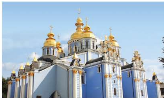
2 Михайлівський Золотоверхий собор/St. Michael's Cathedral Михайлівська площа/Michael's Square www.archangel.kiev.ua

Зведений в XI ст. князем Володимиром Великим, це один із найдавніших храмів Київської Русі, що зберігся до наших днів. Собор став частиною архітектурного образу Верхнього Києва. / The Cathedral was built at the beginning of the XI century by Prince Volodymyr the Great. It is one of the oldest cathedrals of Kyivan Rus that has survived to present day. The Cathedral has become an integral part of the architectural landscape of upper Kyiv.