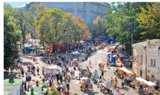
8 Андріївський узвіз/Andriivsky Descent Контрактова площа/Kontraktova Square www.uzviz.com.ua

Цей парк був закладений у XIX ст. Його площа становить понад 10 гектарів. Парк розміщений на верхній і середній терасах Михайлівської гори. У 1853 р. в західній частині було споруджено пам'ятник князю Володимиру. / This 10 hectares park was founded in the XIX century on the upper and middle terraces of Mykhailivska Hill. In 1853 the monument to Prince Volodymyr was placed on the western grounds.