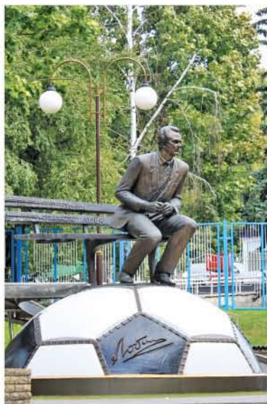
10 Стадіон ФК «Динамо» Київ ім. В. Лобановського / FC "Dynamo" Stadium in honour of V. Lobanovsky Вул. М. Грушевського, 3 / M. Hrushevsky St, 3 www.fc.dynamo.kiev.ua

Вперше відкритий в травні 2011 р., парк став улюбленим місцем мешканців Києва та гостей столиці України. Тут представлені творчі фантазії та мистецькі композиції українських дизайнерів. / Opened in May 2011, this park immediately became a must-see attraction to residents and visitors of Kyiv. The park consists of creative, imaginative and artistic pieces that are created by Ukrainian designers.