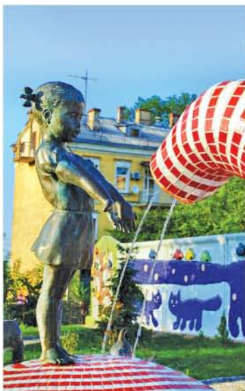
9 Український парк сучасної скульптури та інсталяції Kyiv Fashion Park / "Kyiv Fashion Park" of modern sculptures and installation Пейзажна алея/Peyzazhna alley www.fashionpark.kiev.ua

Одна з найстаріших вулиць Києва, що з'єднує нижню частину міста Поділ з центральною частиною міста Дитинець. Узвіз – це місце виставки-продажу живопису і виробів народної творчості. Його називають київським Монмартром. / Andriivsky Descent that is one of the oldest streets of Kyiv connects Kyiv's uptown with the historically commercial Podil neighborhood. Today it is widely known for exhibiting, selling paintings and folk art. Andriivsky Descent is also popularly called Kyiv's Monmartre.