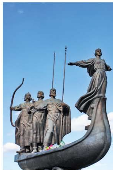
11 Пам'ятний знак на честь заснування Києва / Monument dedicated to the founders of Kyiv Наводницький парк/Navodnitsky Park

У 1934 р. на місці царських оранжерей товариство «Динамо» побудувало стадіон. У травні 2002 р. стадіон було названо іменем відомого українського тренера та футболіста В. Лобановського. / In 1934 the greenhouses were torn down by the football club "Dynamo" to build a stadium. In May 2002 the stadium was named in honour of Valeriy Lobanovsky who was the famous Ukrainian football player and coach.