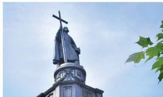
7 Володимирська гірка та пам'ятник Св. Володимиру/Volodymyrska Hill and Monument of St. Volodymyr Володимирська гірка/Volodymyrska Hill

За різноманітністю колекцій живих рослин та масштабами території сад займає провідне місце серед ботанічних садів Європи. Унікальний колекційний фонд налічує близько 11 180 таксонів, що відносяться до 1 347 родів рослин. / With a variety of species and wide expanse the garden has earned a prestigious place among other botanical gardens throughout Europe. A unique collection of 11 180 taxa, belonging to 1 347 genre of plants, can be viewed within the floristic outlay of the grounds.