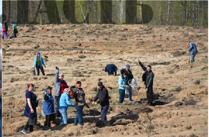
МЕШКАНЦІ СТУДЕНИКІВСЬКОЇ ОТГ САДЯТЬ ЛІС (ДУБ, ГОРІХ, СОСНА)