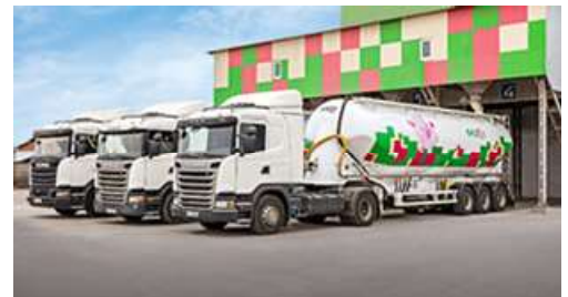
СП ТОВ «Нива Переяславщини»