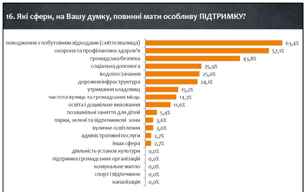
Діаграма 3.2. Оцінка важливості факторів, які мають найбільший вплив на якість життя і публічні послуги, і які повинні мати особливу підтримку для досягнення збалансованого місцевого розвитку.

Пріоритетом для мешканців виступає охорона і профілактика здоров'я та освіта і дошкільне виховання.