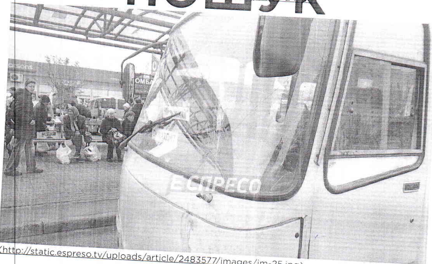
( http://static.espreso.tv/uploads/article/2483577/images/im-25.jpg )