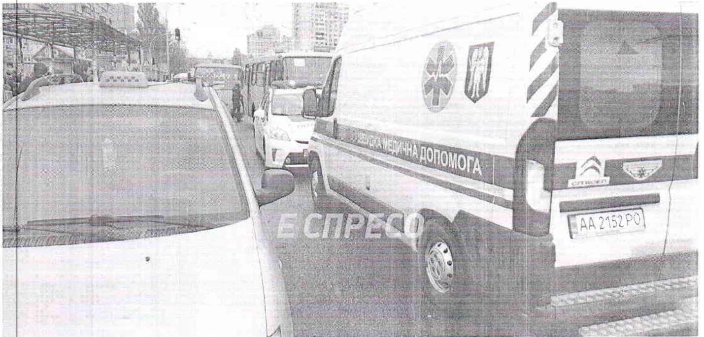
( http://static.espreso.tv/uploads/article/2483577/images/im-21.jpg )