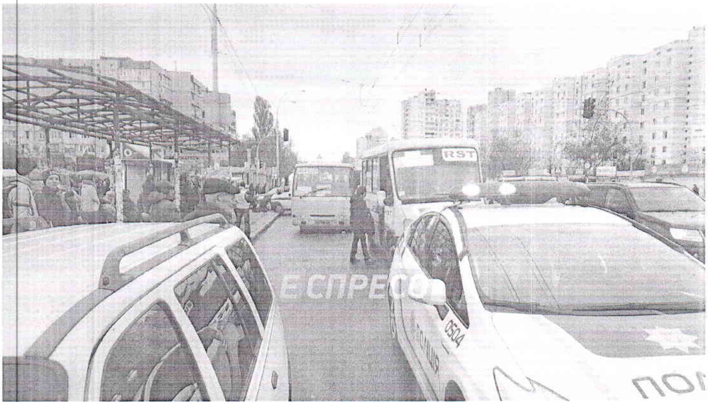
( http://static.espreso.tv/uploads/article/2483577/images/im-22.jpg )